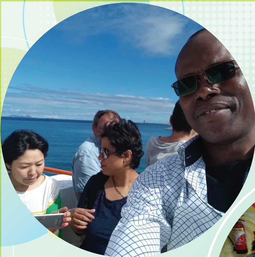
EXCURSION AUX ILES SAINTES