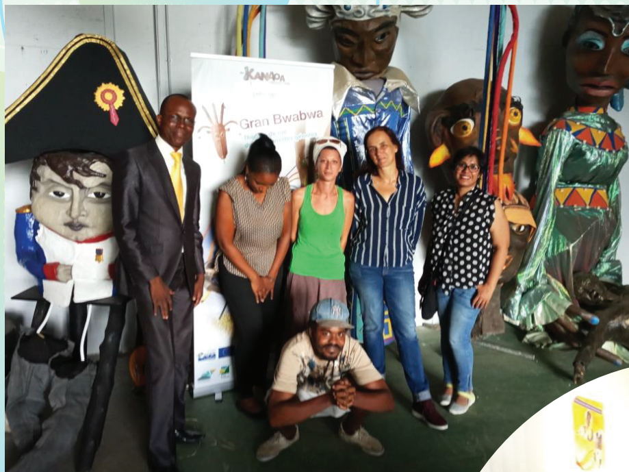
PHOTO AVEC EQUIPE DE GRANN BWA BWA