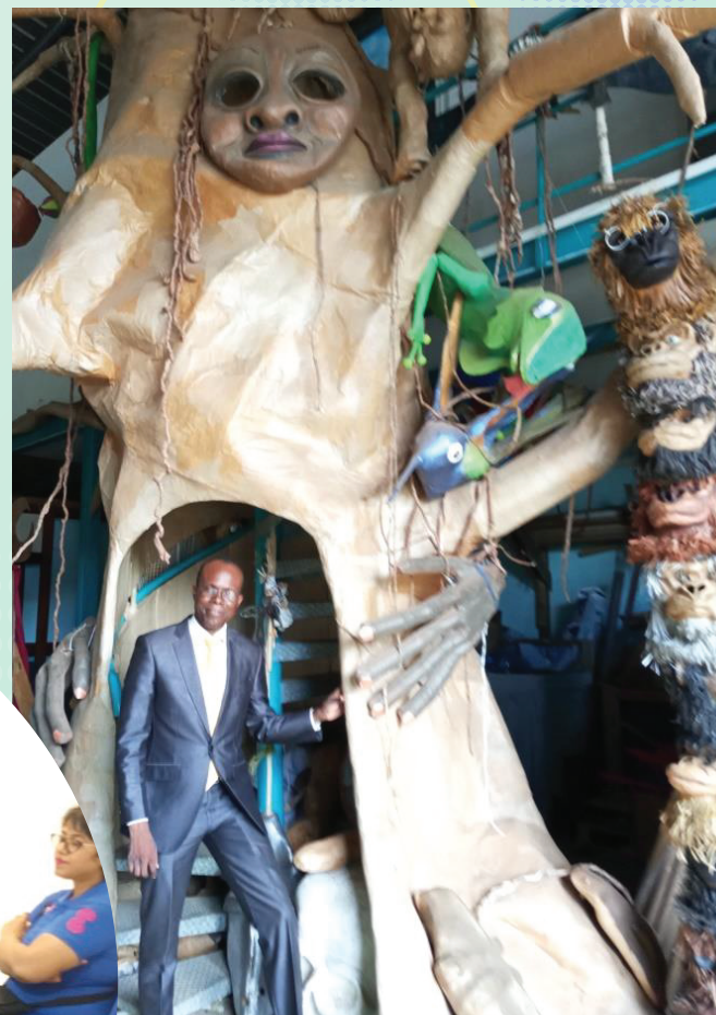
PHOTO SOUS UN MASQUE EN FORME D1 ARBRE