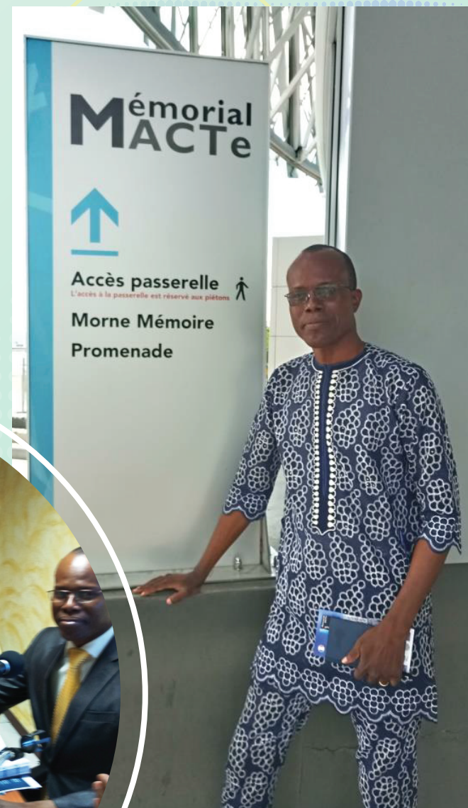
VISITE A MEMORIAL ACTe