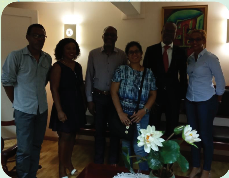
PHOTO AVEC PRESIDENT DE CRESS ET SON STAFF