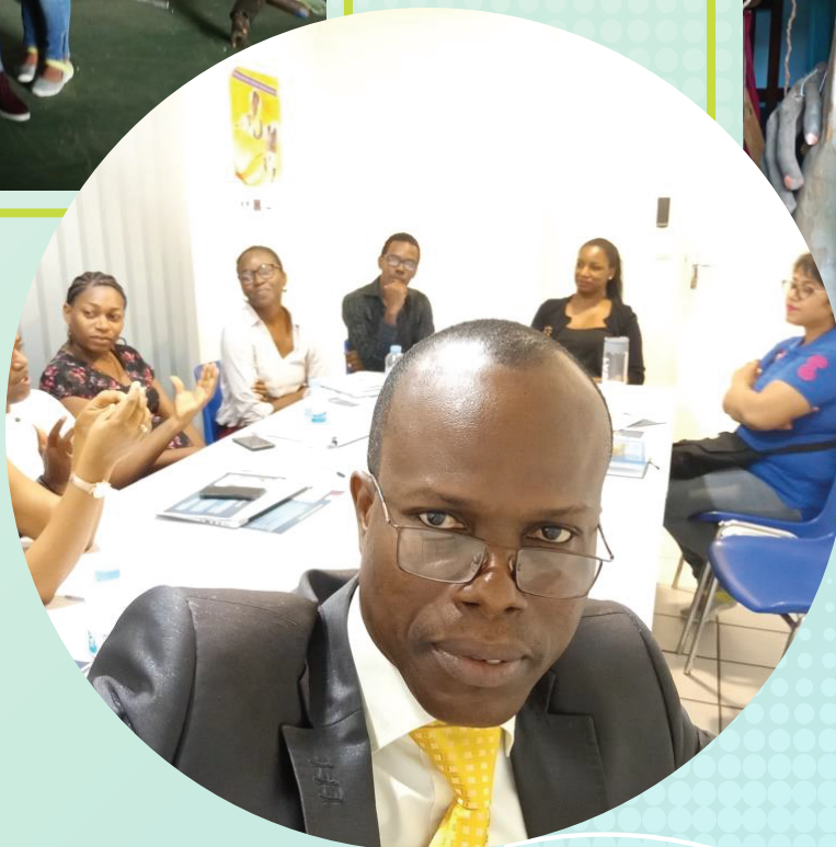
SEANCE AVEC LES RESPONSABLES DE DLA ET ESS