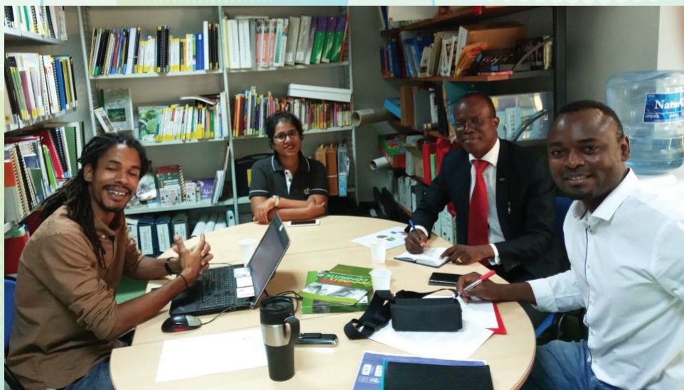
SEANCE A IREPS