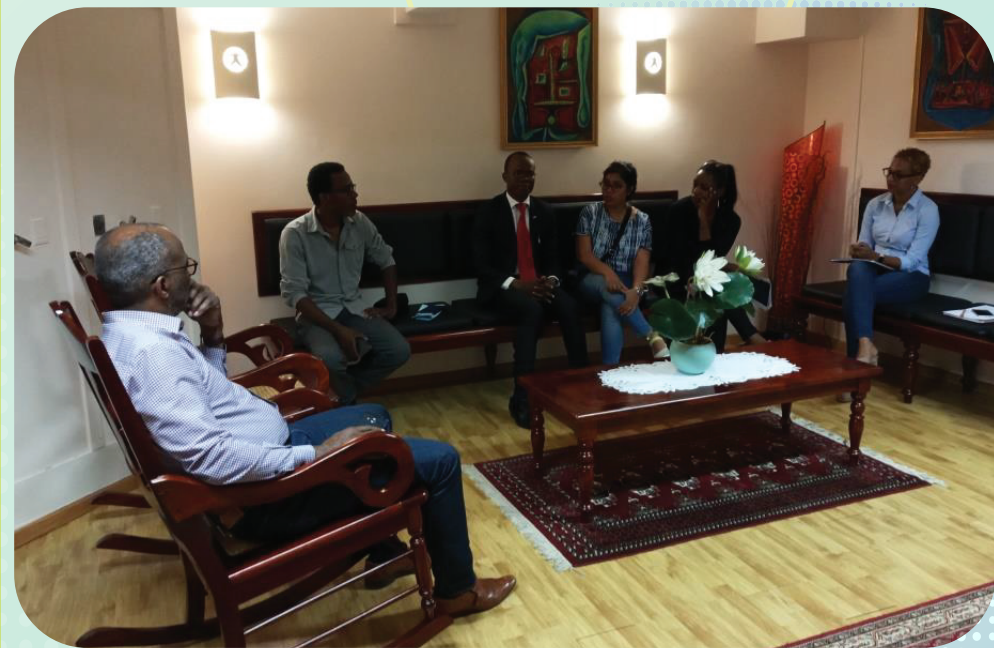
SEANCE AVEC PRESIDENT DE CRESS ET SON STAFF