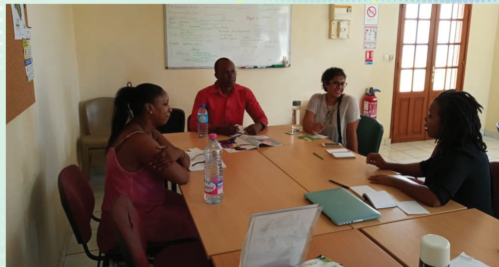
SEANCE AVEC L'EQUIPE DE PAWOKA